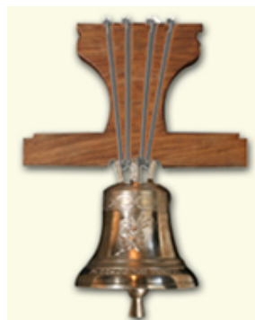
Diám. 37 cm Nota Do# Precio:2.352+IVA