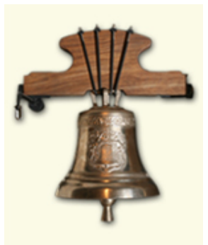
Diámetro: Ø325mm Nota teórica Ré# 1.862+IVA