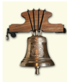
Diámetro : Ø390mm Nota teórica Do 2.527+IVA

Cenefa 17 Euros +IVA Caracteres 4 Euros/un. +IVA Imágenes 14 Euros +IVA Distintos acabados bajo demanda