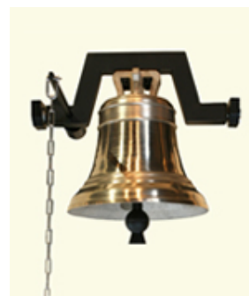
Diámetro : Ø390mm Nota teórica Do 2.326+IVA

Cenefa 17 Euros+IVA Caracteres 4 Euros/un. +IVA Imágenes 14 Euros+IVA Distintos acabados bajo demanda