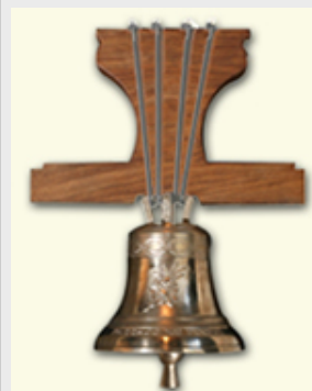
Diám. 39 cm Nota Do Precio:2.684+IVA

Cenefa 17 Euros+IVA Caracteres 4 Euros/un.+IVA Imágenes 14 Euros+IVA Distintos acabados bajo demanda