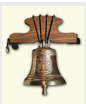
Diámetro : Ø160mm Nota teórica Do 1.123+IVA