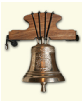
Diámetro : Ø270mm Nota teórica Fa# 1.372+IVA