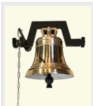
Diámetro : Ø160mm Nota teórica Do 830+IVA