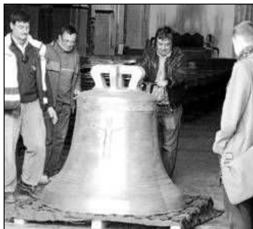
La campana Salvador es la más grande de su conjunto.

La empresa, junto a la iglesia y el Ayuntamiento vinarocense componen la fundación que organiza los actos entorno a este cuarto centenario. Cabe destacar que la Iglesia costeará la campana de 400 kilos, que se llamará Misericòrdia , y el consistorio la más pequeña, de 270 kilos, que llevará por nombre Sebastià .