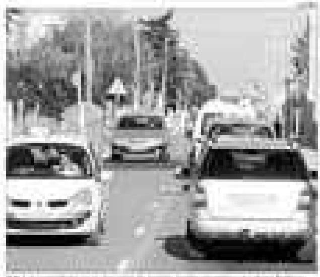
La zona que quedará en suspenso por el plan de urbanismo.